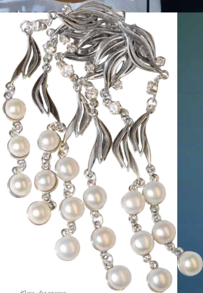
Юлия Ачалюгина для компании «РосЮбс.инТрем»