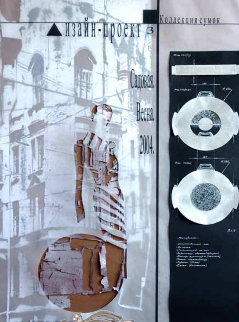
Плакат-реклама коллекции сумок. Автор Олеся Терентьева, руководитель Л. А. Корюкова