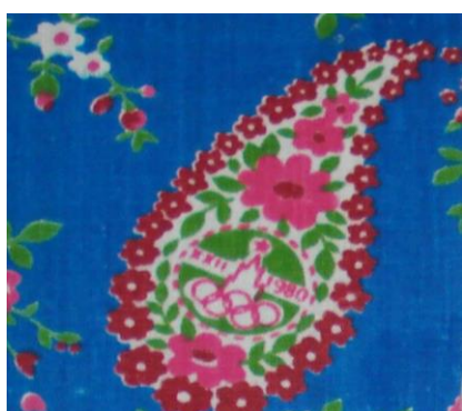
Рис.12. Ситец. С.Н. Казарцева, 1978