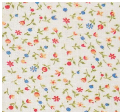
Рис.10. Ситец. А.А. Заикина, 1984