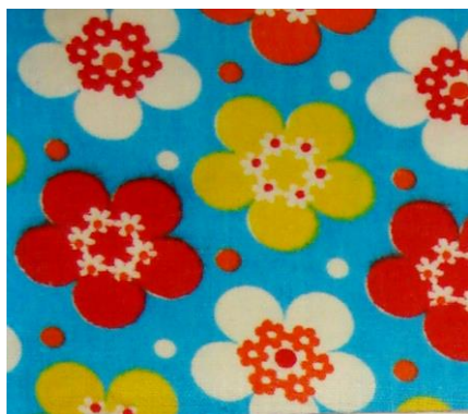
Рис. 3. Ситец. Н.А. Гузикова, 1974

- растительный орнамент разнообразен в своей трактовке и изобразительном решении и делится на три основных вида: упрощенные и геометризированные цветочные рисунки (Рис.3), образно-реалистическая трактовка мотивов с включением разнообразных художественных приемов (Рис.4) и традиционное исполнение цветочного орнамента с ясной моделировкой объема (Рис.5);