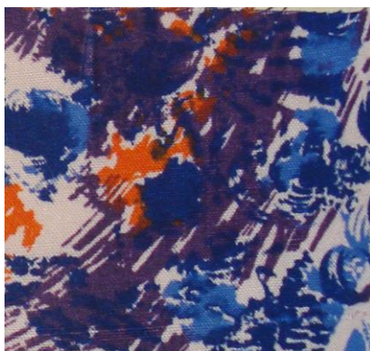
Рис.7. Штапельное полотно. П.Н. Прыткова, 1959