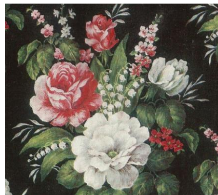
Рис.5. Рисунок на сатин. Е.И. Мигунова, 1973

- геометрический орнамент, состоящий из простых форм (горох, полосы, квадраты), которые свободно масштабируются и комбинируются в зависимости от фактуры и назначения ткани;