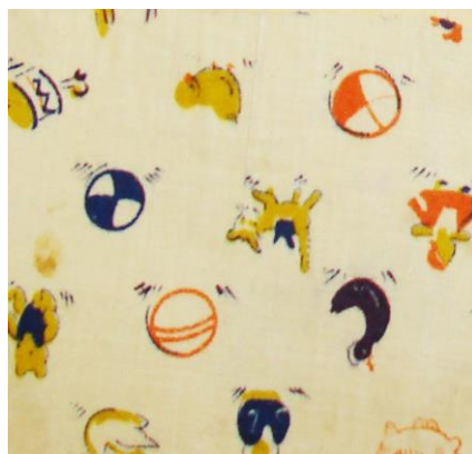
Рис.19. Ситец. П.Н.Прыткова, 1958