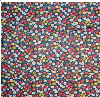
Рис.15. Ситец. Л.М. Уварова, 1979

Комбинированный тип орнамента представлял собой рисунки, соединяющие мотивы из разных орнаментальных групп. Например, в работе могли быть объединены мотивы восточного и европейского происхождения (Рис.17).