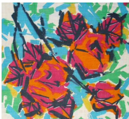
Рис. 4. Ситец. Неизвестный автор, 1961