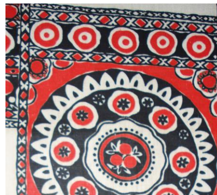
Рис.11. Бязь. Т.А. Терентьева, 1967

В подразделе 2.4 «Творческие эксперименты ивановских художников в процессе поиска оригинальных решений оформления текстиля» отмечены основные новаторские идеи ивановских художников в процессе поиска оригинальных способов украшения текстиля исследуемого периода. Это: