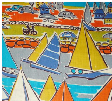
Рис.6. Ситец. Неизвестный автор, 1961

- беспредметный орнамент, включающий ассоциативные рисунки, имитирующие природные состояния, поверхности материалов, художественные техники, шрифтовые рисунки и т.д.(Рис.8).