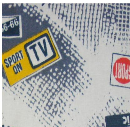
Рис.18. Бязь. Неизвестный автор, 1989

- заимствование западных тенденций в оформлении текстиля, в частности использование декоративных элементов стиля поп-арт - изображений объектов массовой культуры и предметов быта (помады, флаконы духов и прочее). В геометрическом орнаменте встречались элементы стиля оп-арт (Рис.20).